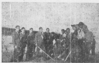
Na szybowisku pod Wasilkowem.

Tęgo roku odbyły się poraz pierwszy w Białymstoku loty zimowe. Świadczy to o wielkiej ruchliwości naszych pilotów i ich zamiłowaniu do szybownictwa, albowiem nieliczne tylko koła szybowcowe w Polsce urządzają loty zimowe, gdyż są one bardziej ryzykowne, niż letnie, ale dają więcej doświadczenia, o co głównie chodzi pilotom, myślącym o dalszej karierze w szybownictwie. Do latania w zimie skłoniło poniekąd i szybowisko, ponieważ najwyższe zbocze leży od strony północnej i można nad nim latać tylko przy wietrze północnym, który w lecie wieje o wiele rzadziej, niż w zimie.