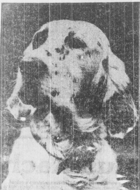
Jeden z najciekawszych psów myśliwskich w Anglii budzi podzw św. torda na londyńskiej wystawie psów.