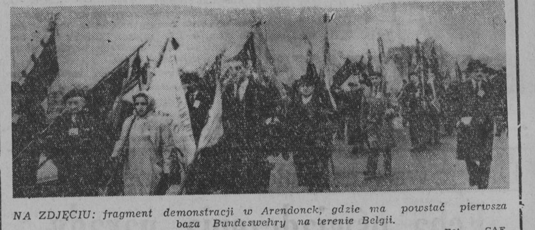
NA ZDJĘCIU: fragment demonstracji w Arendonck, gdzie ma powstać pierwsza baza Bundeswehry na terenie Belgii.