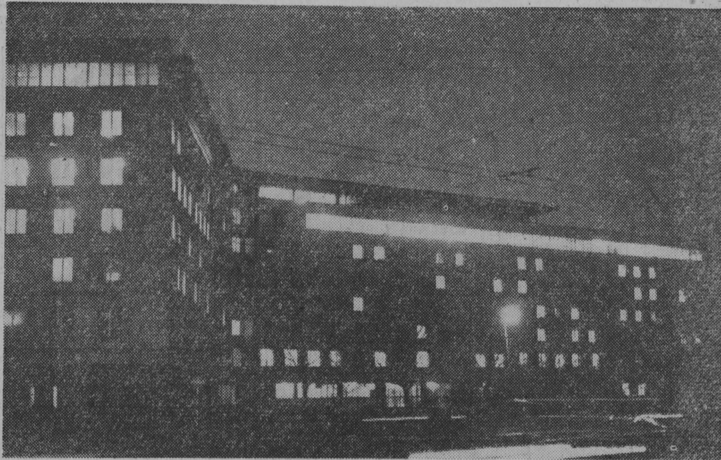
Wieczór 6 grudnia 1960 roku. W budynku Głównego Urzędu Statystycznego w pracu. Sztab pracowników czuwa nad prawidłowym i planowym przebiegiem Spisu Powszechnego.