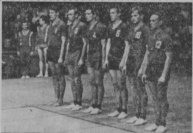
NA ZDJĘCIU: mistrzowie świata z Rio de Janeiro — siatkarze ZSRR.

W Warszawie zakończyły się wczoraj, drużynowe mistrzostwa Polski w szpadzie i szabli. W obu broniach tytuł zdobyły zespoły warszawskiej Legii. (jap)