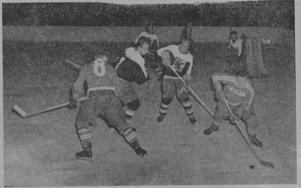
Sezon w lidze hokejowej rozpoczął się na stołecznym Torwarze meczem Legii z bydogską Polonią...

Mecz stał na dobrym poziomie i było wiele ciekawych momentów. Drużyną lepszą tym razem była Gwardia, która rozegrała jedno z lepszych swych spotkań w sezonie.