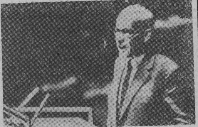
Władysław Gomułka wygłasza swoje przemówienie na XV sesji ONZ.

Z trybuny ONZ, na której skupiona jest uwaga wszystkich ludzi troszczących się o losy świata, rozległ się głos Polki. I to, co mówił z tej trybuny tow. Gomułka, stanowi poważny wkład naszego kraju w walkę o pomyślne losy świata.