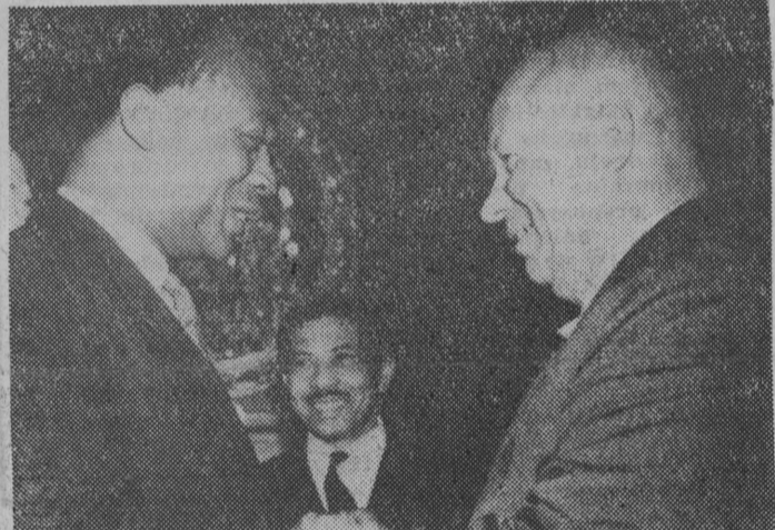
NA ZDJĘCIU: prezydent Republiki Ghany Nkrumah składa wizytę premierowi Chruszczowowi.

JUTRO jak zwykle „MAGAZYN”, gdzie znajda nasi Czytelnicy m. in. relację z procesu rewizyjnego lek. AMELII KOSTKOWSKIEJ.