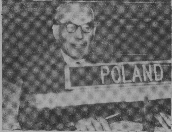
I sekretarz KC PZPR Władysław Gomułka na sali obrad podczas otwarcia XV sesji Zgromadzenia Ogólnego NZ.

RZYM (PAP) 21. 9. Liczba śmiertelnych ofiar straszliwej powodzi, jaka nawiedziła ostatnio Włochy, wzrosła do 50. Nad zalana szosa Via Aurelia, która została zamknięta przez liczne obawy ziemi, krąży stale helikoptery, w poszukiwaniu zaginionych podróżnych. W południowych Alpach zalanych zostało przeszło 300 miejscowości. Tysiące ludzi pozostało bez dachu nad głową. Jak dotychczas, nie nie zapowiada końca katastrofy. Ulewne deszcze i gwałtowne wiatry trwają nadal.