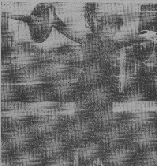
Złota medalistka w pchnięciu kulą, doskonała lekkoatletka radziecka Tamara Press, wiele uwagi podczas treningów poświęca wyrobieniu siły.