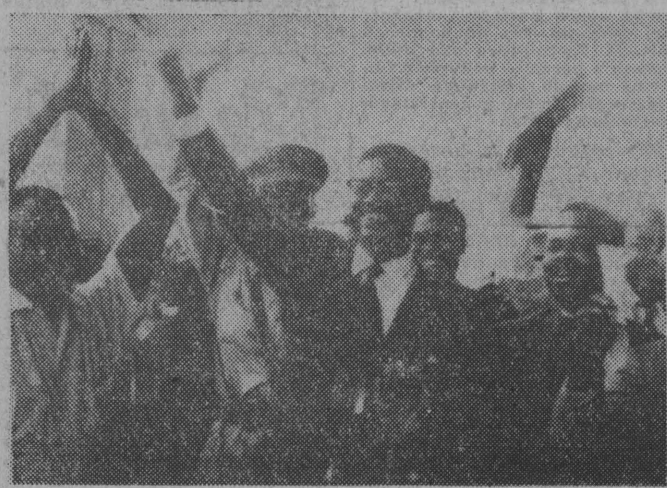
NA ZDJĘCIU: premier Kongo P. Lumumba w otoczeniu współpracowników dziękuje za owacje, po wyrażeniu mu przez kongijską izbę reprezentantów votum zaufania.

(Na str. 2 piszemy o Afganistanie — pierwszym kraju, który odwiedzi premier J. Cyrankiewicz.)