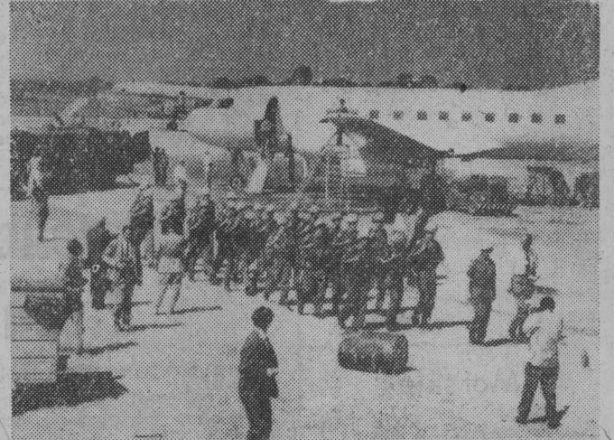
Zołnierze szwedzcy wchodzący w skład oddziałów ONZ w stolicy Katangi — Elisabethville.

środe na konferencji prasowej skierowanie wojsk kongijskich do Katangi, jeśli ONZ nie spełni prośby w sprawie wysłania do Konga obserwatorów z krajów afrykańskich.