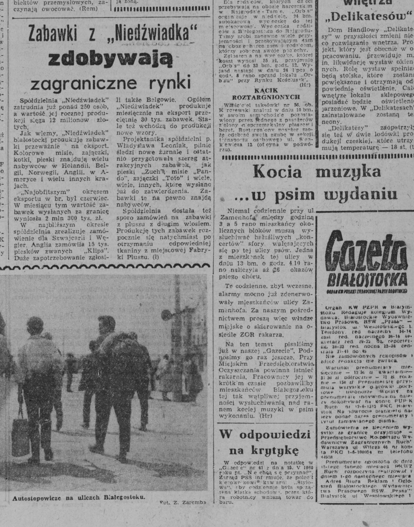
Autospowizce na ulicach Białostoku.