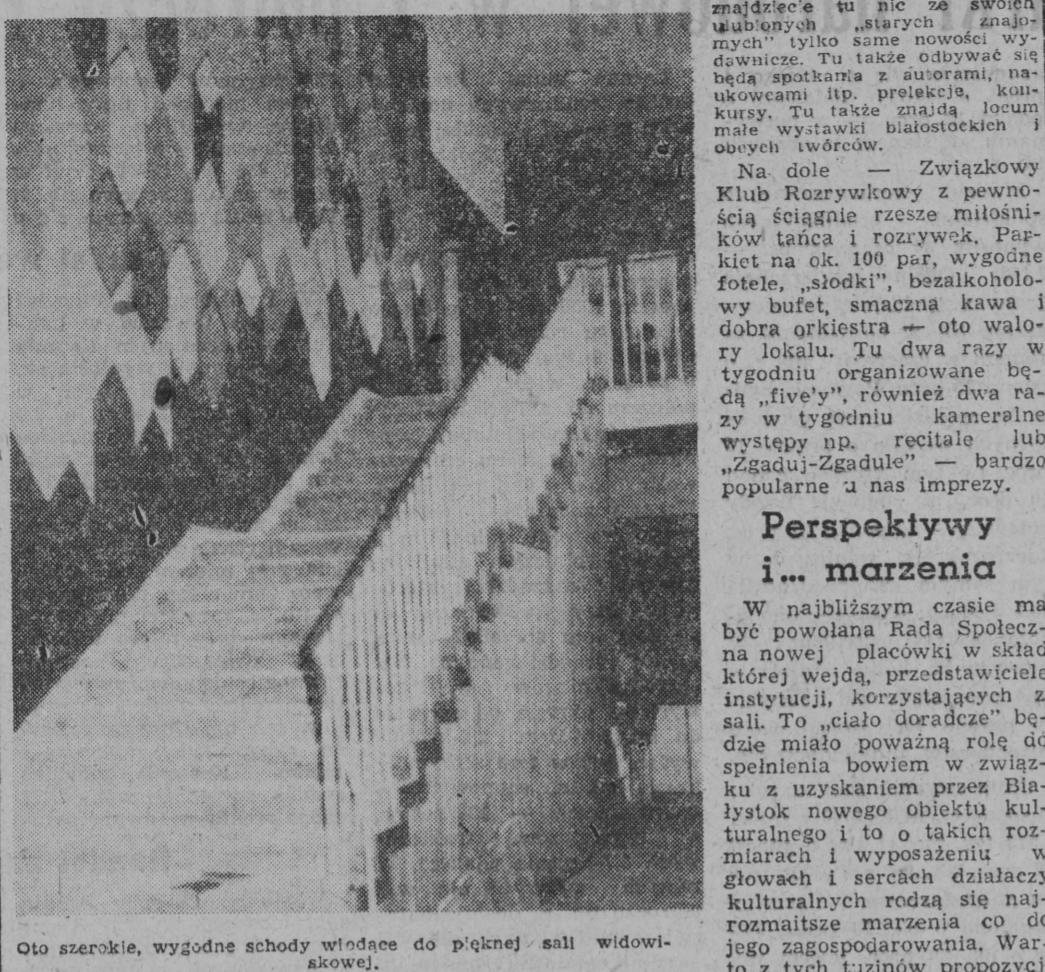
Oto szerokie, wygodne schody widzące do pięknej sali widowiskowej.

Na dole — Związkowy Klub Rozrywkowy z pewnością ściąganie rzesze miłośników tańca i rozrywki.