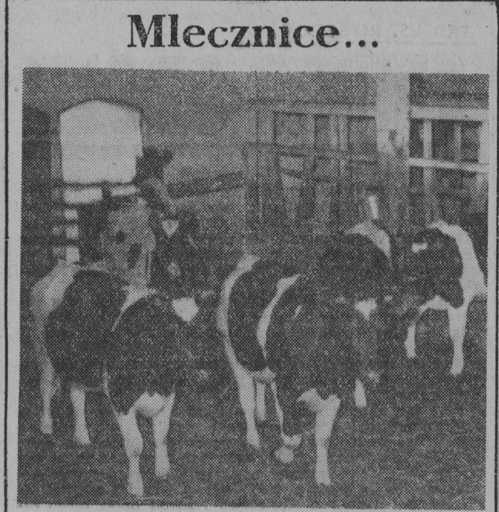
Spółdzielnia produkcyjna Kokoskowskiej w pow. Stargard specjalizuje się w hodowli bydła mlecznego...