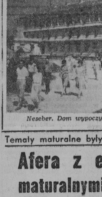
Neseber. Dom wypoczynkowy dla chłopów.