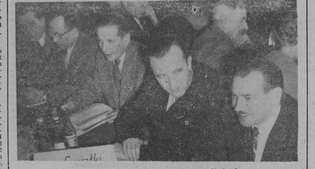
Delegaci z powiatu suwalskiego na sali obrad.