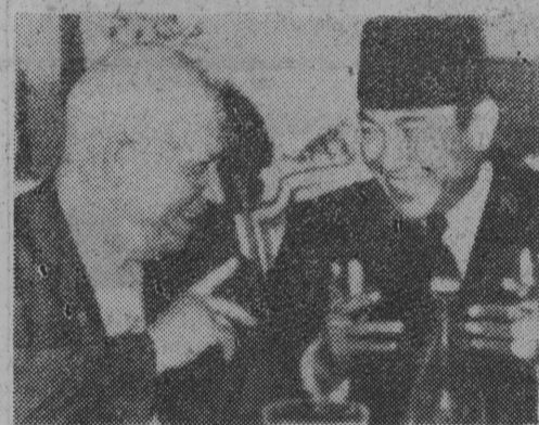
NA ZDJĘCIU: przewodniczący Rady Ministrów ZSRR N. S. Chruszczow na przyjęciu w pałacu Merdeka u prezydenta Indonezji — Sukarno.