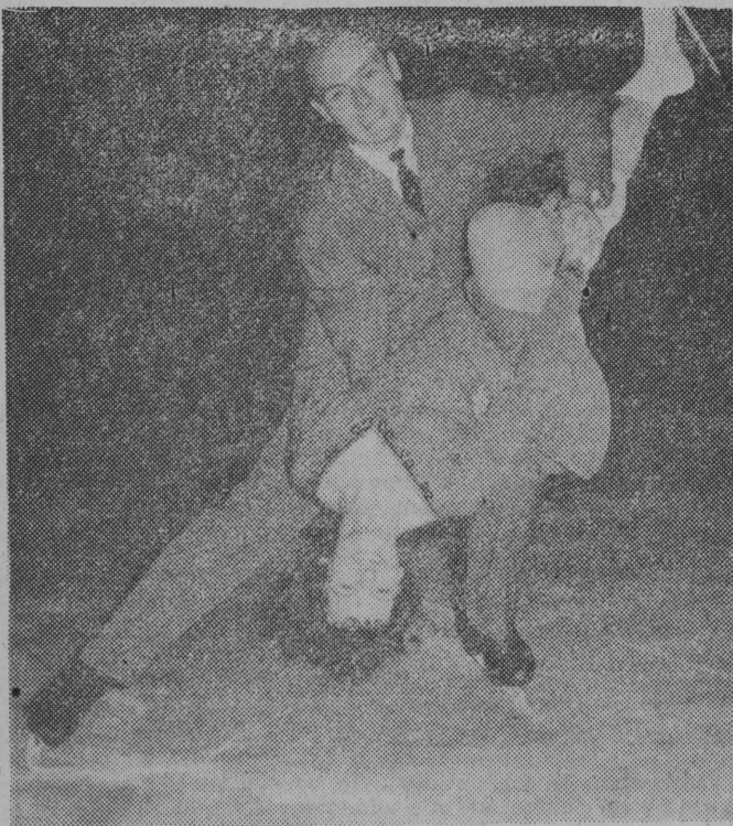
NA ZDJĘCIU: para kanadyjska Wagner — Paul, która zdobyła złoty medal w jeździe figurowej parami na lodzie.