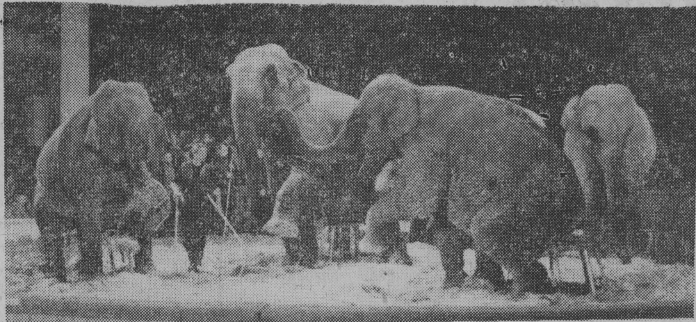
Słonie cyrku „Aeros” z Lipska przybyłego na występy do Polski.