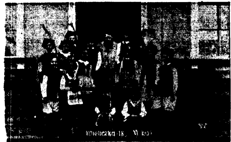
W uroczystościach złożenia ziemi z pobojowisk amerykańskich na kopcu na Sorbicku wziął udział jako reprezentant prezydenta Roosevelta ambasador St. Zjednoczonych Cudaży, który następnie odwiedził Wileńskę. Reprodukujemy tu zdjęcie p. ambasadora ubranego w strój górnikowski pośród dziewcząt w strojach krakowskich.

Gotowanie na gazie jest ekonomją pieniędzy i czasu.