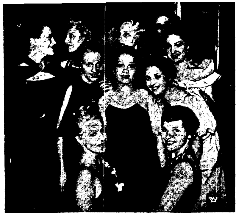
Kilka modeli najnowszych w modnym sezonie uczesań, demonstrowanych na specjalnym pokazie w Rydze.