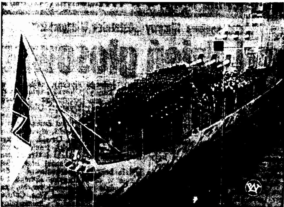
Nowy krążownik niemiecki, „Nürnberg”, został niedawno spuszczony na wodę w Kilonii.

świadczył, iż uzyskał sumę 113 tysięcy fr. Oskarżony oświadczył ponadto, iż miał pełne zaufanie do Stawiskiego wobec stosunków, jakie posiadał oszust. Na pytanie, jakie to były stosunki, Desbrosses nie chciał wymieniać żadnej osobistości politycznej.