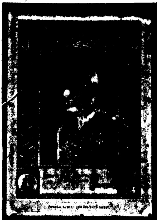
Generalny Inspektor Sił Zbrojnych gen. dyw. Edward Rydz-Śmigły na swym portrecie, uwidocznionym na ilustracji, skreślił odręcznie hasło: „Swego nie damy... Nietylko nie damy całej sukni, ale nawet guzika od niej... Hasło to, wypowiedziane przez gen. dyw. Edwarda Rydz-Śmigłego na zjeździe Legionistów w Krakowie 6 sierpnia r. b., stało się dominującym w czasie tegorocznych uroczystości obchodu 17-ej rocznicy Odzyskania Niepodległości.