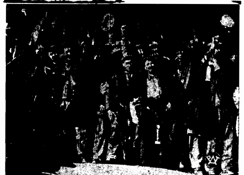
Strajkujący górnicy angielscy, po wyjściu z kopalni w Nine Point — demonstrują po angielsku.

1szy poranek dla MŁODZIKÓW I DZIECI w operze niedziela, 27 b. m. 12 g. w poł. podwójne widowisko baletowe: WIESZCZKA LALEK I PRZEKORNA LIZETTA Ceny zależne od 30 gr. do 2.50 zł.