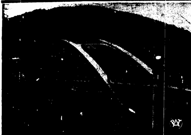
Most na Trzesznie, w wojew. krakowskim, zbudowany staraniem Fundu- ssu Pracy.