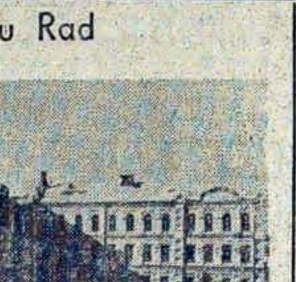
Gruzijński Instytut Rolniczy im. L. P. Berila jest jednym z największych wyższych zakładów naukowych Republiki Gruzji...