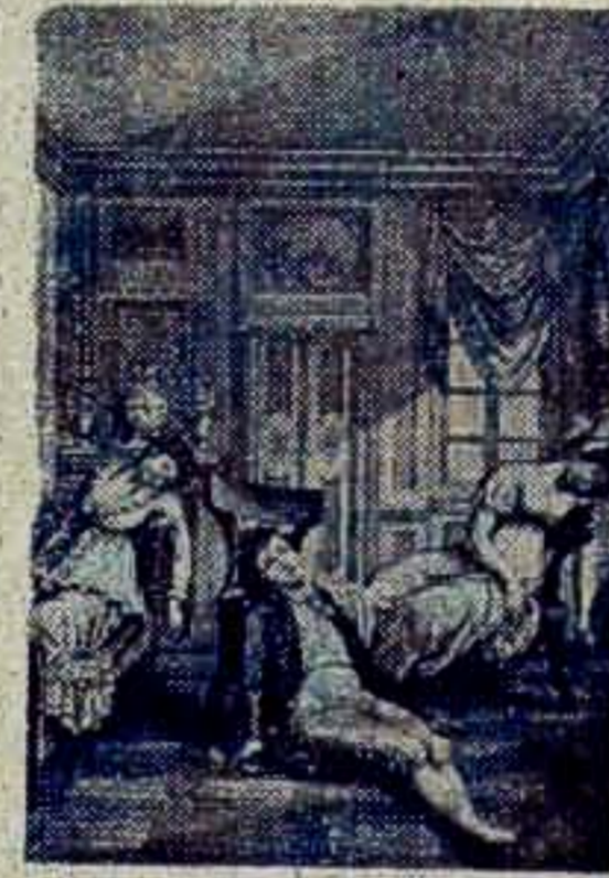
Scena ze sztuki W. Bogusławskiego pt. „Spazmy modne” w starego sztuchu.