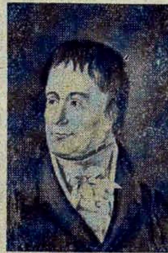
Wojciech Bogusławski według współczesnego portretu nieznanego malarza.