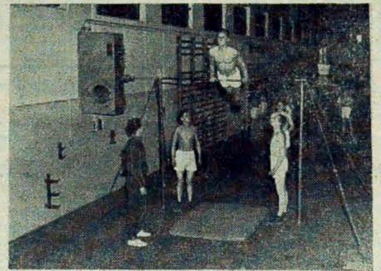
Sport zajmuje poważną pozycję w programie wyszkolenia bojowego żołnierzy Ludowego Wojska Polskiego. Wyrabia on siłę, wytrzymałość i szybką orientację, które stanowią podstawowe zalety żołnierza. Zdjęcie przedstawia ćwiczenia podchorążych Oficerskiej Szkoły Piechoty.

Dodać należy, że zagadnienie zdobywania norm SPO b. poważnie potraktowane zostało przez członków klubu.