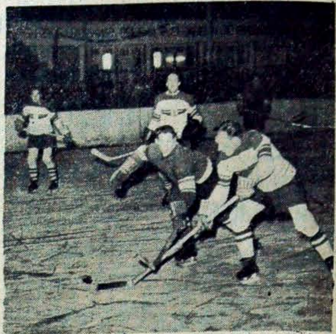
Zgrupowani na obozie przedolimpijskim w Katowicach najlepsi hokeiści polscy rozegrali treningowe spotkanie dwóch zespołów, zakończone zwycięstwem zespołu B w stosunku 6:2. Na zdjęciu fragment spotkania.