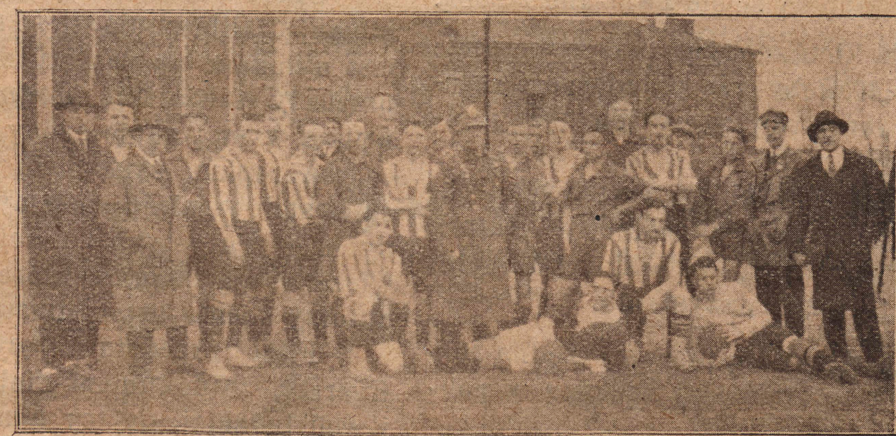
Drużyny Ż. K. S. i W. K. S. 42 p. p., które rezebrały zawody z wynikiem 5:1 na korzyść W. K. S. 42 p. p.

Jakie miejsce przypadnie w udziale naszemu W. K. S. 42 p. p. zobaczymy.