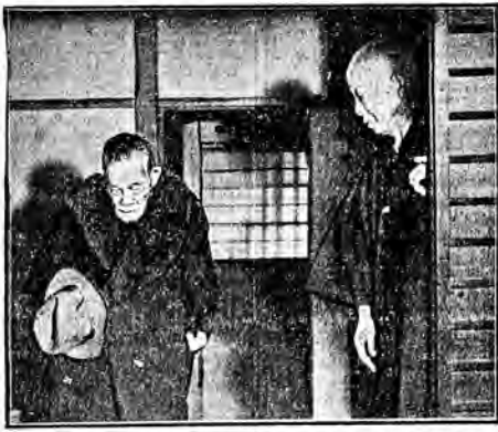
Dziesiąt zdjęcie premiera Inukai, zgrzybiałego starca, w chwili powrotu do domu.