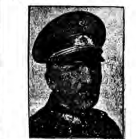
General Schleicher, przywódca kamary-generałów, został przyjęty na audjencję przez kanclerza Brüninga. General Schleicher uprzedzony jest przez swolucjowców na dyktatora Niemiec.