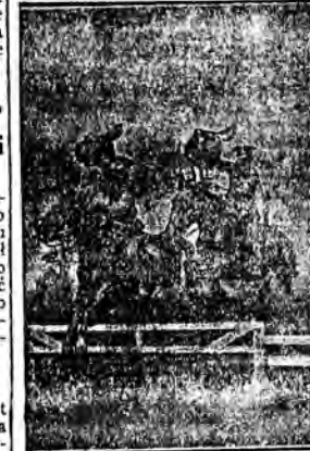
W Windsorze w Anglii odbyły się wielkie popisy konnej gwardji angielskiej. Na zdjęciu widzimy dwóch żołnierzy konnej gwardji angielskiej w jeździe z przeszkodami, jadących na oklep z stadłami w rękach.