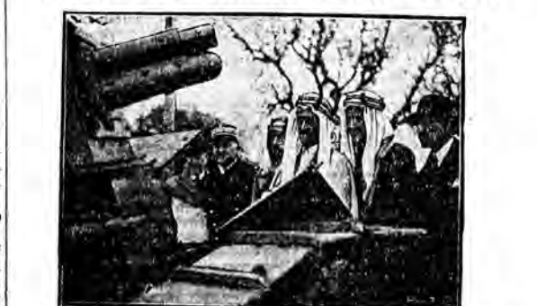
Emir Feisal, wice-król Hedżasu, przybył do Paryża. Po audjencji u Prezydenta Republiki Emir udał się na Camp de Satory, aby przyrzec się manewrom lekkich tanków. Na zdjęciu widzimy Emira Fei sala (po środku) siedzącego z bliskimi tożkimi tanki.