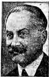
Prezydent senatu ALBERT LEBRUN.

Paryż, 8 maja (Od wł. kor.) Cała Francja została wstrząśnięta zamachem na prezydenta Doumera. O godzinie 11-ej w nocy rozszedły się alarmujące pogłoski jakoby prezydent Doumer był umierający.