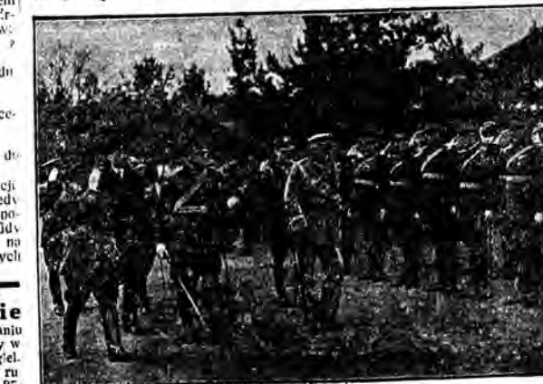
Marszałek Piłsudski, przechodzi przed frontem 16 p. p. im. marszałka Piłsudskiego w Falcionie.