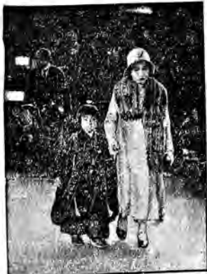
Kajęczniczka Teruko, najstarsza córka cesarza Japonii udaje się poraz pierwszy w towarzystwie swej gwernantki do szkoły.