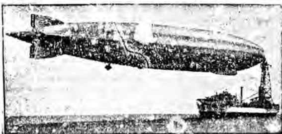
Wskutek akcji oszczędnościowej amerykańska Izba Reprezentantów uchwaliła wycofać ze służby sterowiec „Los Angeles”.