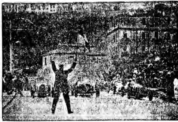
Start do wyścigu samochodowego o „Wielką Nagrodę Monaco”, uważanego ze względu na górzysty teren i liczne ostre zakręty za najtrudniejszą próbę dla automobilistyk.