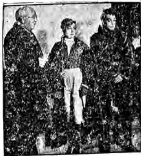
Premier Azana (po lewej stronie) obok głównych postaci napisanego przez siebie dramatu „La Corona”, który grany jest na scenach madryckich z dużym powodzeniem.