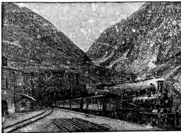
Południowy wjazd do 14-kilometrowego tunelu św. Gottharda, otwartego po 10-letniej budowie w roku 1862.