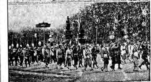
W stolicy Sjamu Bangkok odbyły się kilkunastodniowe uroczystości z okazji 150-lecia panowania obecnej dynastji królewskiej. U góry: Gondola królewska, poruszana wiosłami 80 marynarzy. U dołu: Uroczysta procesja, w której król niesiony jest w lictyce w otoczeniu gwardji.