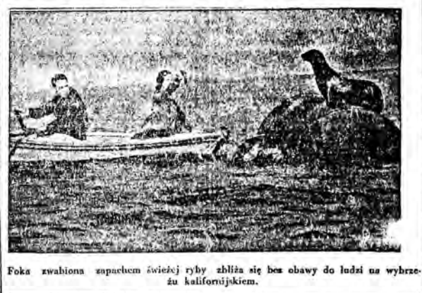
Foka zwabiona zapachem świeżej ryby zbliża się bez obawy do ludzi na wybrzeżu kalifornijskim.