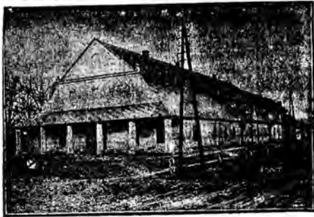
Wiekowy zabytek historyczny: zajazd hetmański z XVII wieku w Podhorcach, pow. Złoczów.