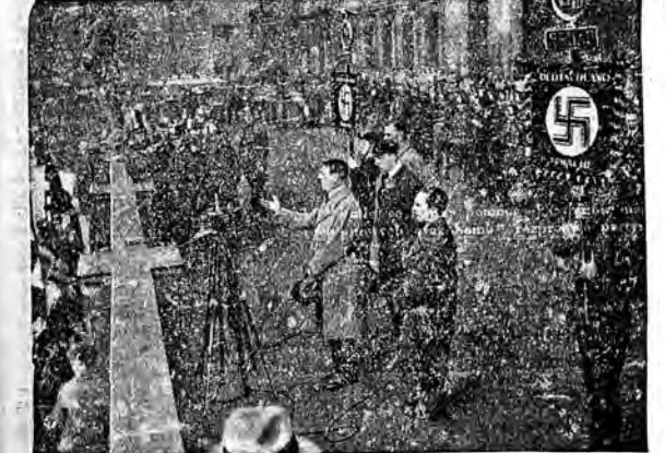
masówki urządzanej przed niedzielnymi wyborami dożalownikami na prezydenta Rzeszy. Obok Hitlera stoi bez kancelusza jego szef sztabu dr. Goebbels