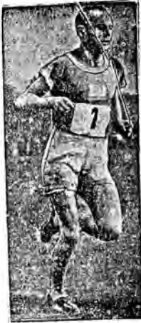
Paavo Nurmi tuż przed olimpiadą został zdziwili lekkoatletyczny z powodu naruszenia zasad amatorstwa.