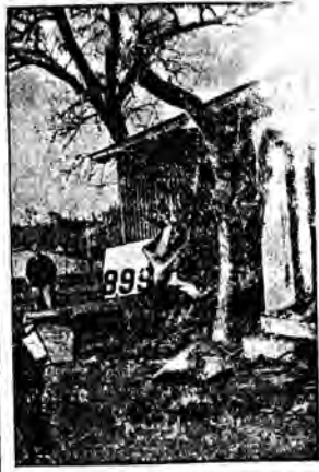
Monachijka lotnik Kinner odwiedził na swjonetce swoją wieś rodzinną w Górnej Bawarii i wykonywał nad domem ojca ewolucje.