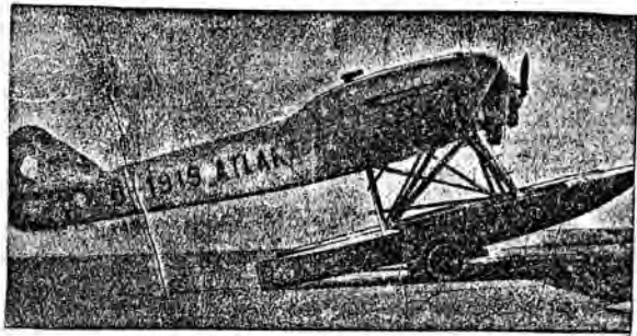
Statek oceaniczny „Bremen” otrzymał na wy samolot katapultowy dla przewożenia poczty z oceanu do Ameryki. Poprzedni samolot zatonął u brzegów Ameryki w ubiegłym roku.