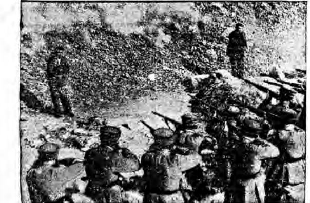
Rozstrzelanie dwóch bandytów w Atenach, którzy zamordowali i obrabowali szofera.