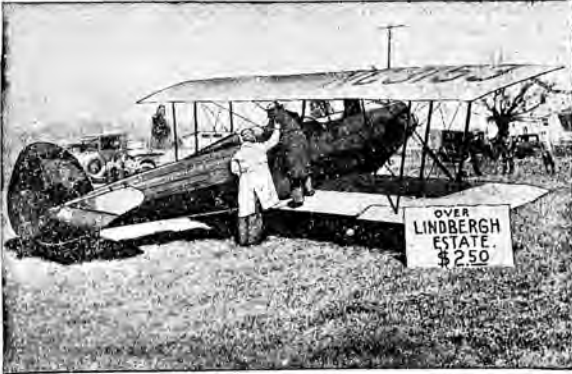
W Ameryce nawet na cudzym nieszczęśliu robią interesy. Takśowa samolotowa obwozi oczekujących za opłatą 2 i pół dolara nad domem Lindberghów, skąd porwanio dziecko stawowego lotnika.