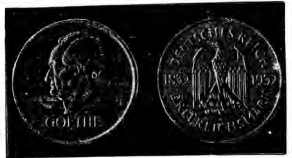
Rzesza niemiecka wybiła nową monetę srebrną trzymarkową ku uczczeniu 50. rocznicy urodzin Goethego.