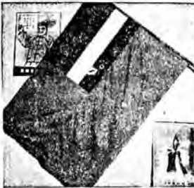
Nowa flaga republiki mardżurskiej.