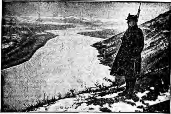
Dolina Dniestru na granicy rumuńsko-sowieckiej, gdzie straż sowiecka w ubiegłym tygodniu rozstrzelała przeszło 1,000 osób, usiłujących przedostać się po lodzie do Sowieców do Rumunii. Wśród rozstrzelanych było 212 kobiet i 40 dzieci. Na pierwszym planie rumuński żołnierz straży granicznej.