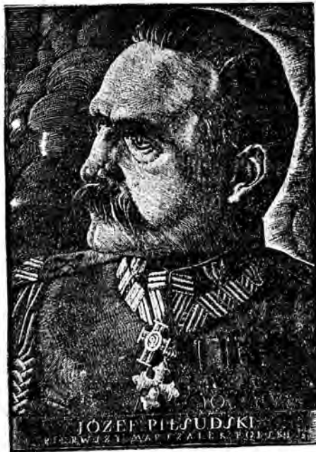
w dniu Jego imienin.