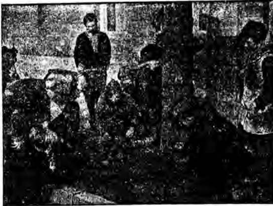
Pierwsze promienie słońca wywabiają na wilgotny i śliski jeszcze chodnik młodzieńców oddających się z całym zapalem rozmaitym grom.