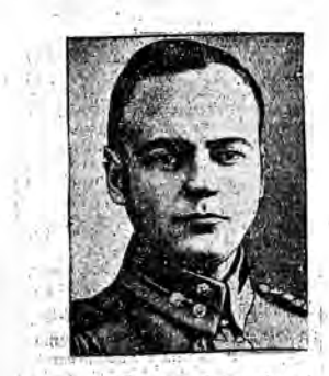
General Wallenius, były szef sztabu skiego, stoi na czele zbuntowanych chłopów.