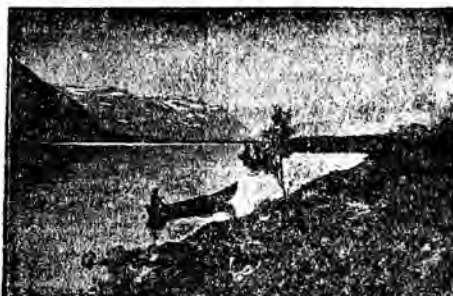
Do najdalej na północ wysuniętych krajów europejskich należy Laponia, kraj wiecznego zima, lodów i białych nocy, nacechowany smutkiem, ponury. Na zdjęciu typowy krajobraz lapoński z widokiem na góry Kebnekaise z doliny rzeki Ladjojaure.