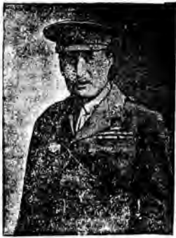
Don Alfonso Carlos Bourbon — Este glo-wa hiszpański: Karlistów, ogłosił orę-dzie w którym stwierdza, że linja Bour-bon — Este nie zrezygnowała ze swoich-praw do tronu.