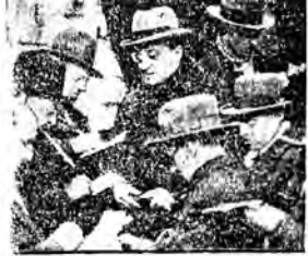
Włóczy: Pamięć zawiadł ma dziennikarstwo o nieudaniu się swej misji. U dołu: arden, dyktuje dziennikarzom listę swego nowego gabinetu.