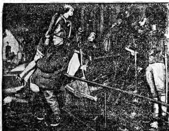
W nowoorskim muzeum wybuchł pożar w estacie dużej panoptikon na świecie. Większość historycznych figur spłonęła. Straży pożarnej udało się tylko drobna część figur uratować z morza płomieni.