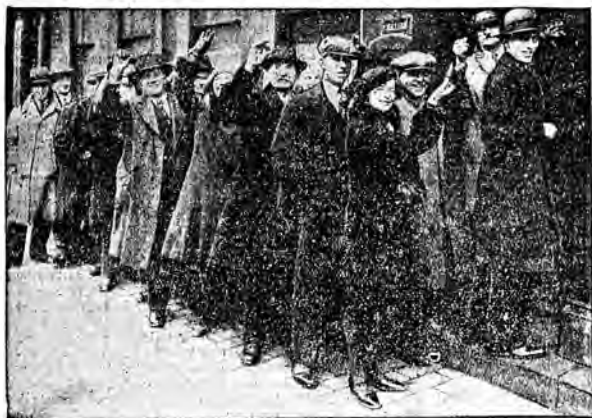
Ogonki przed sklepami złotniczymi w Londynie. Cena złota osiągnęła taki wysoki kurs, że Anglii masowo sprzedają chowane dotąd pieczęlowe monety złote. Jest to oznaka wiary w kurs funta papierowego.