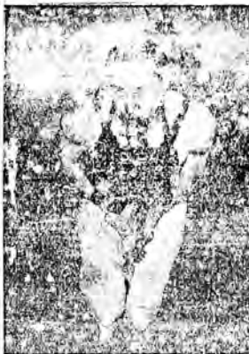
Daremna praca nurków podczas prób uratowania zatoniętej łodzi podwodnej M 2.