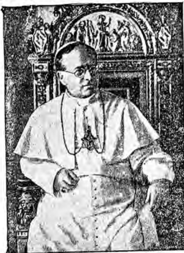
Najnowsze zdjęcie Ojca św., który dnia 6-go lutego obchodzi dziesięciolecie pontyfikatu.