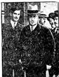
1) Nowe znaczki szwajcarskie wydane z okazji otwarcia konferencji rozbrojeniowej. 2) Byli angielski minister spraw zagranicznych, Henderson, przewodniczący genewskiej konferencji rozbrojeniowej.