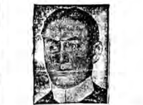
Sofus Michaelis jeden z najwybitniejszych poetów Danii zmarł.

System ten polega na umieszczeniu pod powierzchnią ulicy, na 50 do 100 metrów przed właściwym sygnalizatorem świetlnym i przed skrzyżowaniem ulic, lub trudnem miejscu, automatycznej instalacji, która zaczyna działać, kiedy nacisnie na nią z czar