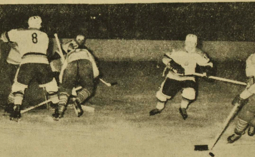
Reprezentacja Polski w hokeju na lodzie zainaugurowała tegoroczny sezon sportowymi zawodami NRD (w Katowicach i Łodzi). Pierwszy mecz przyniósł wynik 3:3. Hokeiści w rewanżu triumfowali Polacy 2:0. NA ZDĘCIU: atak Polaków na bramkę NRD.

W meczu II rundy rozgrywek o Puchar Króla szwedzkiego Gustawa V polscy tenisiści przegrali w Kopenhage z Danią 0:5.