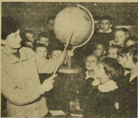
Dzięki nauczycielowi nasze dzieci poznają świat, jego tajemnice i problemy.