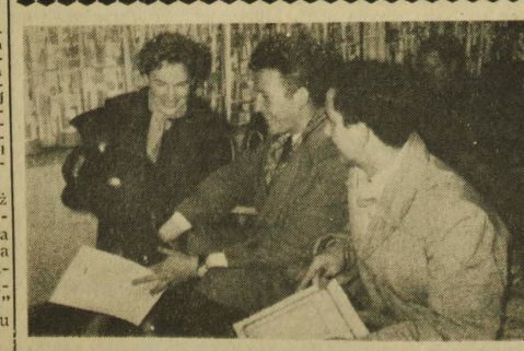
Niedawno odbyły się w Białymstoku zawody strzeleckie o puchar prechodni Białostockiego Zjednoczenia Budownictwa. Startowało 11 zespołów. NA ZDJĘCIU: zwycięska drużyna z Wojewódzkiego Biura-Projektów w Białymstoku.

■ STUDIUM WYCHOWANIA ESTETYCZNEGO przy Klubie WKZZ organizuje kolejny wykład na temat: „Estetyka ubioru i mieszkania”, który odbędzie się dzisiaj o godz. 18 w sali konferencyjnej Domu Związków Zawodowych, III piętro. (a)