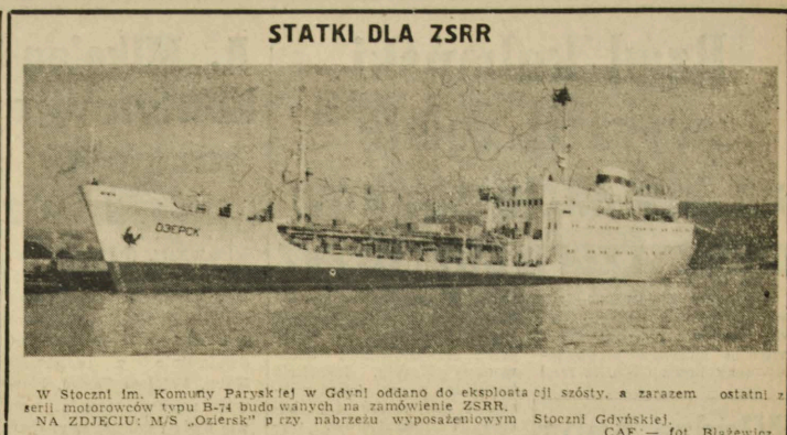
W Stoczni Im. Komuny Paryskiej w Gdyni oddano do eksploatacji szósty, a zarazem ostatni z serii motorowców typu B-74 budowanych na zamówienie ZSRR. NA ZDJĘCIU: M/S „Ozierek” przy nabrzeżu wyposażeniowym Stoczni Gdynińskiej.

Na wniosek aktywno organizacji IV Zjazd zdecyduje o zmianie nazwy na Ligę Obrony Kraju — nazwę bardziej odpowiadającą aktualnym zadaniom organizacji.