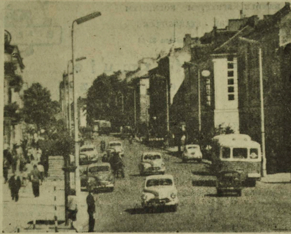
NA ZDJĘCIU: ulica Lipowa w słoneczny dzień.

WYMIANA SYFONÓW - W KAŻDYM SKLEPIE W felietonie "Z uską" p. Lotka, pisaliśmy o kłopotach z wymianą syfonów po wodzie sodowej. Zrzędn PSS uznał naszą krytykę za słuszną i wydał już odpowiednie zarządzenie. Obecnie syfony będą wymieniane we wszystkich sklepach PSS. JESZCZE O WODZIE SODOWEJ W dniu 15 sierpnia zamieściliśmy "Migawkę", w której zwracaliśmy uwagę na brak odpowiedzialności syfonów z wodą sodową. Jak wyjaśnił Zarząd Okręgowy ZSS "Spółem" było to spowodowane brakiem gazu, niezbędnego przy produkcji wody sodowej.