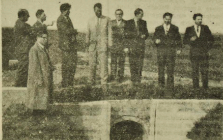
NA ZDJĘCIU: członkowie delegacji zwiędzają roboty melioracyjne na bagnie Wizna.

— Duże wrażenie swą wielkością i nowoczesnością oraz wyposażeniem technicznym wywarł na nas kombinat bawelniany w Zambrowie. Zapoznaliśmy się z osiągnięciami załogi w dziedzinie podniesienia wydajności pracy, zwiększenia