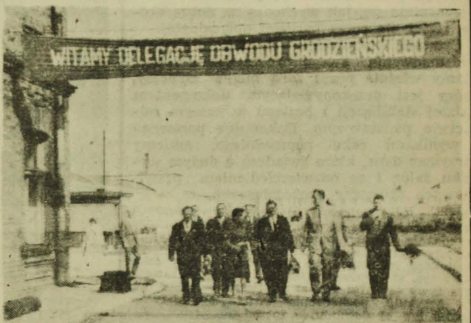
NA ZDJĘCIU: serdeczne powitanie delegacji z Grodna u bram kombinatu w Zambrowie. Witamy Delegację Obwodow Grodzieskiego' — głosi wielki transparent.

— Duże wrażenie swą wielkością i nowoczesnością oraz wyposażeniem technicznym wywarł na nas kombinat bawelniany w Zambrowie. Zapoznaliśmy się z osiągnięciami załogi w dziedzinie podniesienia wydajności pracy, zwiększenia