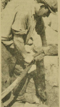
Już 25 kilometrów instalacji gazowej ułożyli pracownicy gazowni. Do końca br. ułoży się jeszcze dalszych 5 km. rur, którymi już niedługo popłynę gaz do naszych mieszkań. NA ZDJĘCIU: Inwagry Północny, przy pracy.

LONDYN (PAP) 23. 7. Premier Gujany Brytyjskiej Jagan, złożył w niedzielę w świątecznym, w którym znów zdecydowanie domagał się niezwłocznego przyznania niepodległości swemu krajowi. Dziennik „Times” informuje, że Jagan równocześnie ostrzegł rząd brytyjski, iż dalsze odraczanie tej sprawy może wywołać poważne wątpliwości, co do konieczności udziału Gujany Brytyjskiej w Commonwealth.