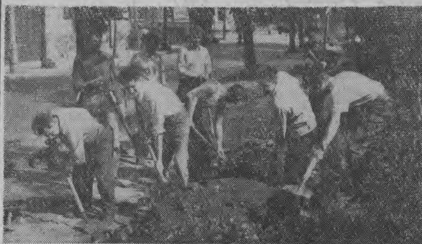
Na cześć 22 Lipca pracownicy Prezydium Miejskiej Rady Narodowej w Białymstoku zobowiązali się uporządkować teren i zasadzić kwiaty na skwerze przy ulicy Lenina. NA ZDJĘCIU: pracownicy Wydziału Spraw Lokalnych Wydziału Architektury i Wydziału Przemysłu porządkują skwer.