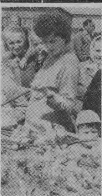
Mamusi z dziećmi najczęściej można było spotkać przy stoiskach z zabawkami. (h)

wają się zwykle bieżące remonty. Chodzi przecież o to, aby wypoczęci uczniowie z nowym rokiem szkolnym rozpoczęli naukę w odnowionych, czystych klasach.