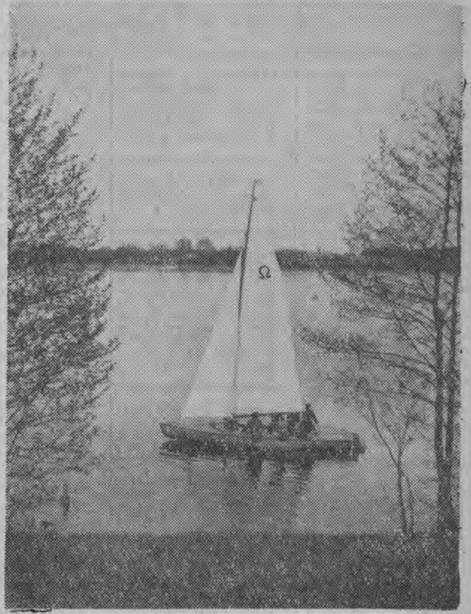
Jezioro Wigry.

Mając na uwadze spopularyzowanie poprzez artystyczne na fotografię masowego wychowania fizycznego i sportu oraz turystyki (najbliższych okolic Białostockiej) i wypoczynku po pracy. Wojewódzki Dom Kultury w Białymstoku przy współudziale WKZZ KW ZMS, WKKFIT, PTT-K TKKF, Białostockiego Towarzystwa Fotograficznego i Redakcji „Gazety Białostockiej” ogłosił w styczniu br. konkurs fotograficzny pt. „Sport i turystyka w obiektywie”.