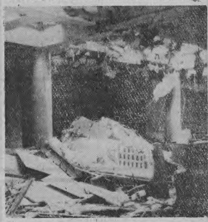
Na kilka godzin przed „zaprzestaniem” akcji terrorystycznej w Algierii — OAS wysadził w powietrze gmach ratusza w Algierze. Faszyści podłożyli pod budynek bardzo silny ładunek plastyczny. Ratusz uległ zniszczeniu przy czym 1 osoba została zabita a 48 osób odniosło rany. NA ZDJĘCIU: wnętrze gmachu algierskiego ratusza po wybuchu ładunku plastycznego.

ALGIER (PAP) 21. 6. 20 bm. nastąpił wybuch zbiorników gazu ziemnego doprowadzonego do Oranu z szypów na Saharze. W wyniku serii 5 gwałtownych eksplozji, powstał ogromny pożar gazu, uniemożliwiający zbliżenie się na odległość mniejszą niż 300 metrów. Policja odciepla kordonami zagrożony teren i ewakuowała z pobliskich domów 800 mieszkańców.