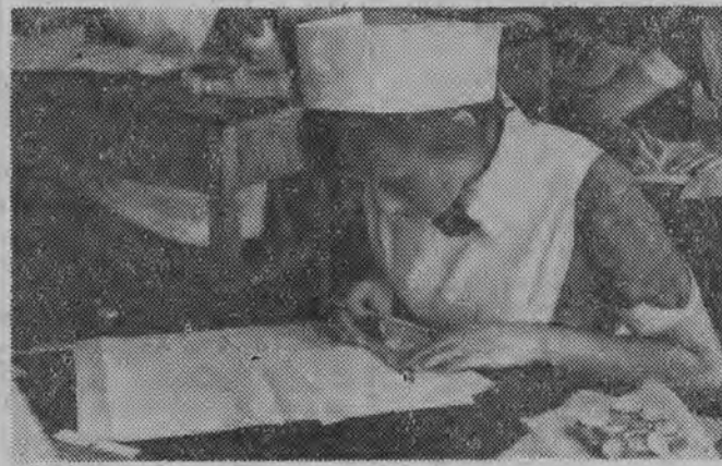
NA ZDJĘCIACH: egzamin pisemny z matematyki.