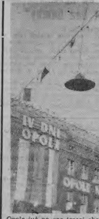
Opole już po raz trzeci obchodzi swoje święto. NA ZDJĘCIU: fragment miasta w odświętnej szacie.