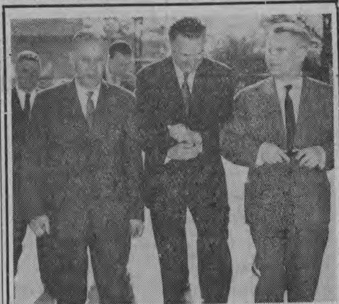
19. VI. 1962 r. opuściła nasz kraj rządowa delegacja radziecka z zastępcą przewodniczącego Rady Ministrów ZSRR — Konstantym Rudniewem na czele. NA ZDJĘCIU: pożegnanie delegacji na lotnisku Okęcie w Warszawie — na pierwszym planie od lewej: K. Rudniew, wicepremierzy — P. Jaroszewicz i J. Tokarski oraz ambasador ZSRR w Polsce — A. Aristow.

NOWY JORK (PAP) 20. 6. W lipcu rozpocznie się nakręcanie zdjęć do pierwszego filmu radziecko-włosko-amerykańskiego, który będzie dramatem z okresu drugiej wojny światowej, 90 procent zdjęć realizowanych zostanie w Związku Radzieckim, a reszta w Rzymie. Reżyserem filmu będzie Giuseppe de Santis. Film opowiadać będzie o odwrocie wojsk włoskich z frontu rosyjskiego podczas zimy 1942 roku.