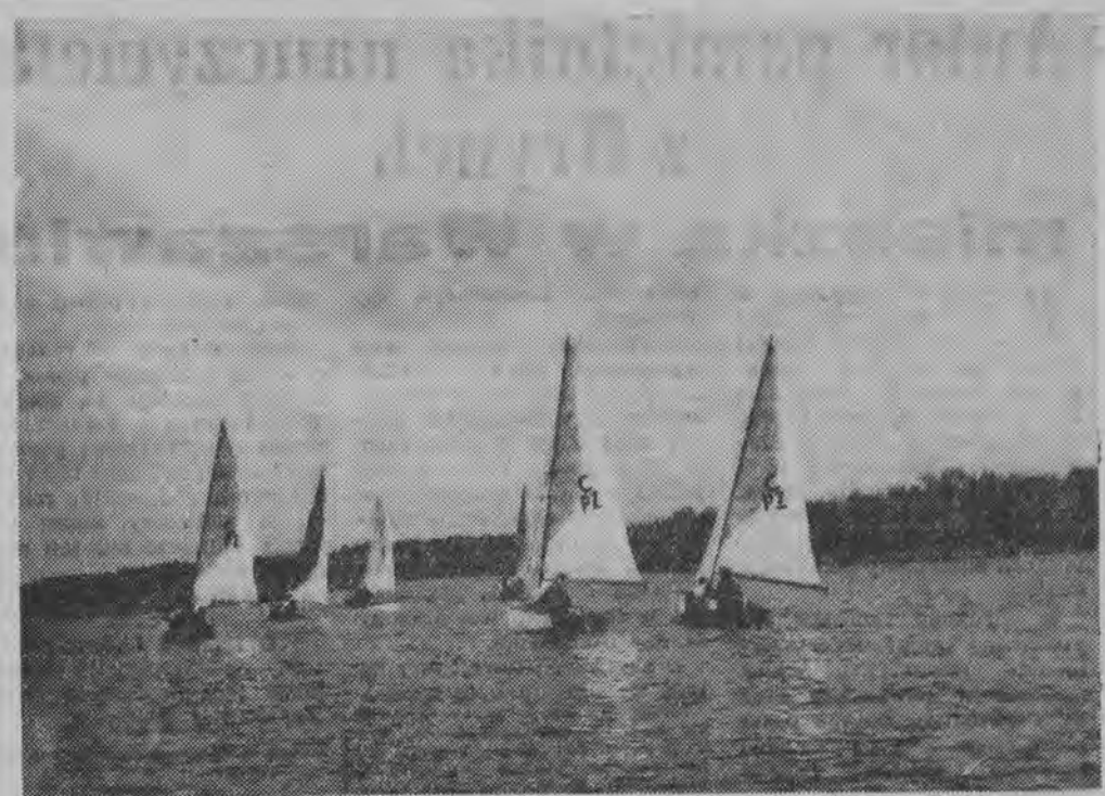
Łodzie żaglowe typu „Kadet” na Jeziorze Necko.

Komitet utrzymuje łączność z PCK, Społecznym Komitetem do Walki z Alkoholizmem i innymi komitetami i placówkami społecznymi.