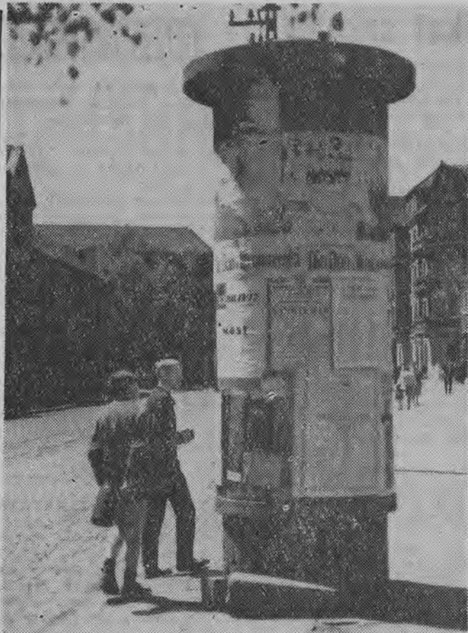
Warto czytać ogłoszenia. Chłopcy, których widzimy na zdjęciu, pasjonują się sportem i wśród innych szukają ogłoszenia o meczu piłkarskim.

W ciągu swego istnienia zespół dał wiele występów zarówno w Białymstoku jak i w innych miejscowościach naszego województwa. Występy cieszyły się zastępnym powodzeniem.