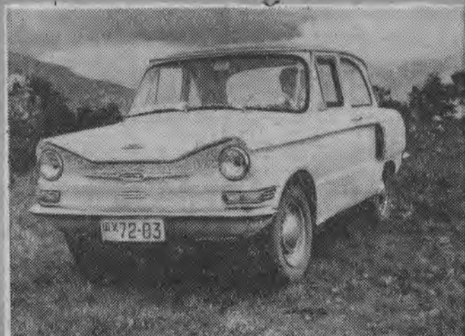
Nowy model małowozowego samochodu „Zaporozhets” wyszedł zwycięsko z próbnej jazdy po górskich szosach Krymu.

Na sesji, która była jednym z centralnych akcentów obchodów 20-lecia PPR, podsumowany został dorobek wielu lat badań nad dziejami partii oraz wytyczono dalsze kierunki prac nad historią PPR.