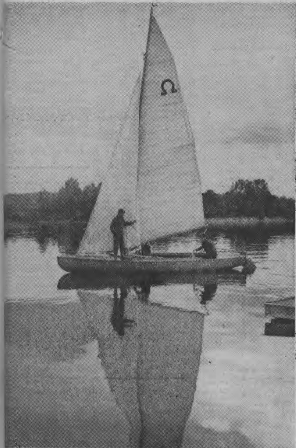
Piękno Ziemi Białostockiej — Jezioro Wigry