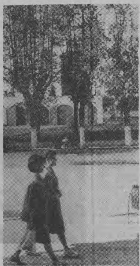
Popołudniowy spacer.

Widoczna jest głęboka różnica jakościowa i różnica koncepcji pomiędzy radziecką propozycją a kontrpropozycją amerykańską, ograniczającą się do redukcji ilości broni rakietowej na razie o 30 proc. oraz do likwidacji niektórych tylko baz, i to w dalszych etapach. Jakież bowiem znaczenie z punktu widzenia bezpieczeństwa zbiorowego i poprawy międzynarodowej atmosfery może mieć zmniejszenie ilości rakiet, skoro każda z nich zdolna jest przenieść ładunek groźący śmiercią i masową zagładą?