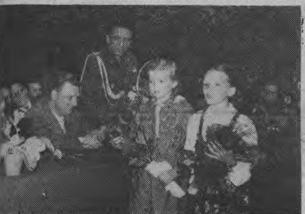
W ogromnym przejęciu przekazała serdeczne życzenia i powitania żołnierzom WOP przybyła na akademię delegacja młodzieży ze Szkoły Pomnika Tysiąclecia w Nowodziele (pow. sokolski). Szkołę tę zbudowali żołnierze WOP.

TOKIO (PAP) 10. 6. Jak podaje agencja Kiodo, amerykańskie władze wojskowe otworzyły na Okinawie specjalną szkołę przygotowującą kadry dywersantów do walki z ruchem narodowo-wyzwoleńczym w krajach Azji. Wśród 100 uczestników kursu znajdują się również żołnierze Ngo Dinh Diema z południowego Wietnamu.