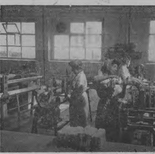
Załoga Czulkowskiej Fabryki Celulozy i Papieru jako pierwsza w przemyśle celulozowo-papierniczym wystąpiła w marcu br. z inicjatywą podjęcia zobowiązań 1-szo majowych i dla uczczenia V Kongresu Związków Zawodowych. Do końca czerwca zobowiązała się wyprodukować m. in. 50 ton celulozy, 32 ton papieru i tektury. NA ZDJĘCIU: dział produkcji sanitarnej waty celulozowej, pracę wykonuje się tu niemal wyłącznie przy pomocy automatów.

LONDYN (PAP) 10. 6. Rząd frankistowski — zawiesił w nocy z piątku na sobotę na okres dwóch lat prawo obywateli do swobodnego wyboru miejsca zamieszkania. Zdaniami obserwatorów politycznych decyzja ta ma związek ze wzmożoną działalnością kół antyfrankistowskich, która nasiliła się zwłaszcza w okresie ostatnich tasi strajków w Hiszpanii. Spotkanie znanych polityków hiszpańskich żyjących na wygnaniu, w którym wzięli udział różne osobistości z Madrytu, wywołało dużą lrykę w kołach rządowych.