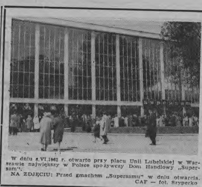
W dniu 6.VI.1962 r. otwarto przy placu Unii Lubelskiej w Warszawie największy w Polsce spożywczy Dom Handlowy „Supersam”.

WARSZAWA (PAP) 7. 6. W związku ze zbliżającym się otwarciem XXXI Międzynarodowych Targów Poznańskich, przybyła do Warszawy 7 bm. rządowa delegacja Mongolskiej Republiki Ludowej. Tego samego dnia przybyły do Warszawy również rządowe delegacje Chińskiej Republiki Ludowej oraz Demokratycznej Republiki Wietnamu.