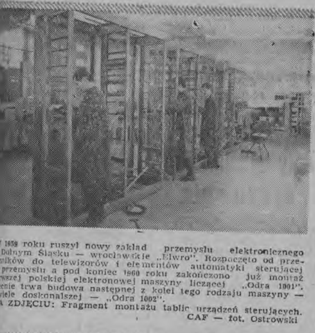
W 1959 roku ruszył nowy zakład przemysłu elektronicznego w Dolnym Śląsku — wrocławskie „Elwro”. Rozpoczęto od przeniesienia do telewizorów i elementów automatyki sterującej przemysłu a pod koniec 1960 roku zakończono już montaż pierwszej polskiej elektronicznej maszyny liczącej „Odra 1001”. Obecnie trwa budowa następnej z kolei tego rodzaju maszyny — wiele doskonalszej — „Odra 1002”.

dziwać odkrycia wielkich złóż różnych metali. Pęknięcie to ciągnie się na obszarze Związku Radzieckiego przez przeszło 1000 kilometrów. Nowo odkryte złożo należy do typu „ślepych”, znajduje się bowiem pod warstwą skał osadowych o grubości równej wysokości 25-piętrowego domu.