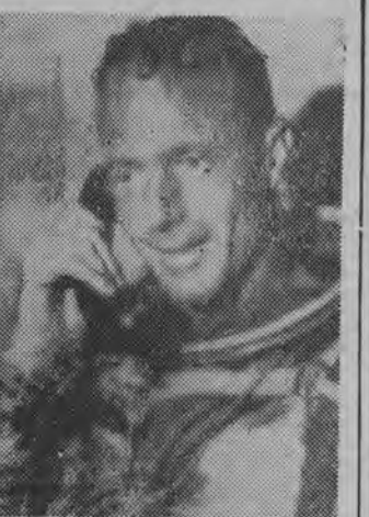
Drugą astronauta amerykański Scott Carpenter rozmawia przez telefon z prezydentem Kennedym po ukończeniu lotu.

NOWY JORK (PAP) 27. 5. To nie była wcale przyjemna wyprawa — ten czwartkowy lot Carpentera wokół Ziemi! Z ostatnich doniesień agencyjnych wynika, iż kosmiczna podróż 37-letniego komandora-porucznika mogła bardzo łatwo zakończyć się tragicznie, oraz że sam astronauta wskutek defektów, zmęczenia i zderzenia z panowaniem nad mechanizmami kabiny. Szczęśliwy pilot odpoczął na wyspie Grand Turk w towarzystwie Johna Glena, lekarzy i ekspertów. Lekarze zbadali go dokładnie, zaś John Glenn i eksperci rejestrowali pilnie wszystkie wrażenia astronauty z 5-godziennej wyprawy i wszystkie szczegóły lotu. Przede wszystkim chcieli się dowiedzieć, co zdarzyło się w ostatniej dramatycznej fazie lotu, aby porównawszy wskazania przyrządów ustalić ostateczną odpowiedź na intrygujące wszystkie pytanie: dlaczego „Aurora 7” wodowała aż 400 (a nie 300 jak obliczano) kilometrów dalej niż należało? Począwszy od drugiej godziny lotu Carpenter musiał co jakiś czas chłodzić nadciężność. Cląg dalszy na str. 2