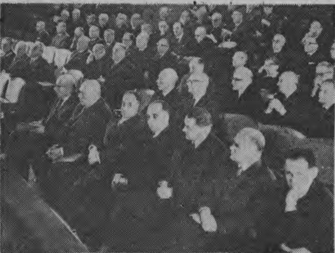
NA ZDJĘCIU: przedstawiciele partii i rządu na sali obrad Ogólnego Zgromadzenia PAN.

W końcowej części obrad Zgromadzenie dokonało wyboru nowych członków PAN — krajowych i zagranicznych.