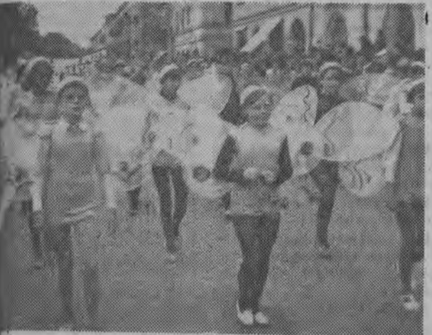
grupa dziewcząt — motylek maszerowała w pochodzie pod hasłami ochrony naszej przyrody ojczystej.

Niedzielną pogodą dopisała. Od wczesnych godzin rannych na ulicach miasta królowała młodzież w barwnych strojach, w maskach, z makietami w rękach. Oglądali się przechodnie, gdy raptem na chodniku widzieli poruszający się „kiosk”