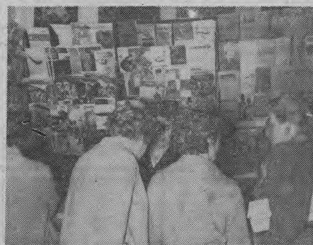
Przed ladą same kobiety. Nadeszły nowe czasopisma.

Księgarnia Klubu Międzynarodowej Książki i Prasy istnieje w Białymstoku już od lat dziesięciu i cieszy się dużym powodzeniem. Można tu kupić nie tylko książki i czasopisma. Księgarnia zaopatrzona jest również w pły-