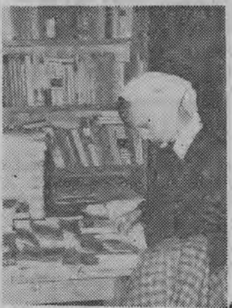
W powrotnej drodze ze szkoły, trzeba oczywiście odwieźć księgarń.

Reprodukcji malarstwa światowego sprzedano na 75 tys. zł.