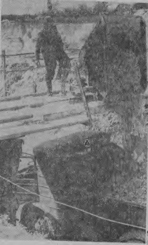
Biała ulica spokojnego Mielnika wskazuje nieomylnie kierunek do kopalni kredy...