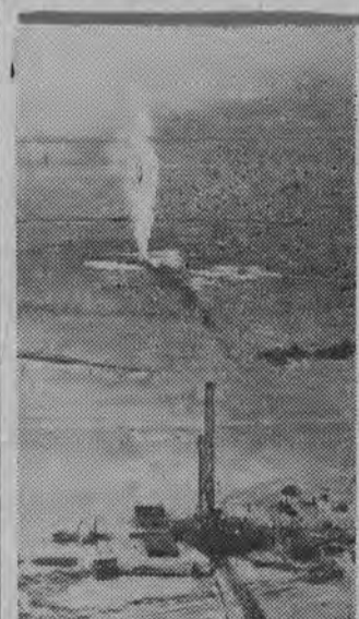
NA ZDJĘCIU: widok z lotu ptaka na płonący szyb w Gassitoul.