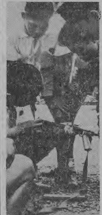
W Indonezji trwa powszechna mobilizacja ludności, która gotowa jest wyzwoić wszelkimi dostępnymi środkami Irian Zachodni stanowiący integralną część Indonezji. NA ZDJĘCIU: członkowie młodzieżowej organizacji indonezyjskiej „Pramuka” podczas ćwiczeń wojskowych.

Wprawdzie wiosna panuje na Wybrzeżu w całej pełni, niemniej niektóre obszary wód dopiero teraz zostały uwolnione od resztek lodu. Najdłuższą pokrywa lodowa utrzymywała się na Zalewie Wiślanym i Zatoce Puckiej.